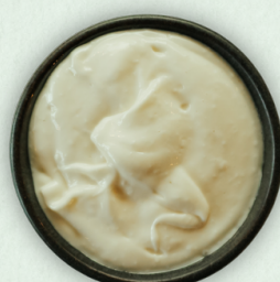
Toum hvidløgs mayo